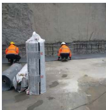
1. Montaż hydroizolacji fundamentowej Proofex Engage.

Fosroc to wiodący producent oraz dostawca wysokowydajnych i niezawodnych rozwiązań dla różnych segmentów rynku, które dostarcza od ponad 80 lat.