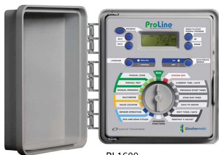
PL1600 4 sekcje bazowe. Rozszerzalny do 16 sekcji PL1624 Model 24-sekcyjny Wymiary: 23,2 cm x 25,7 cm x 10,2 cm