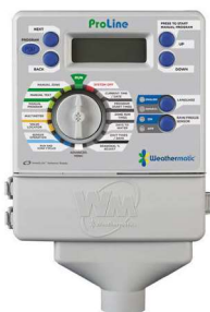
PL800 4 sekcje bazowe. Rozszerzalny do 8 sekcji WYMIARY: 17,8 cm x 19,7 cm x 4,4 cm